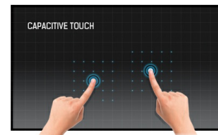
Tecnologia tattile - PCAP

I display IPS sono noti soprattutto per gli ampi angoli di visione e i colori naturali e precisi. Sono particolarmente adatti per applicazioni critiche dal punto di vista del colore.