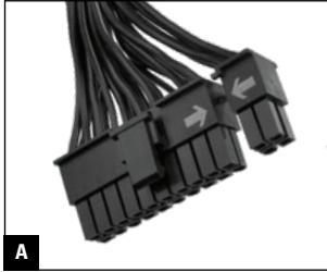
A 550 mm