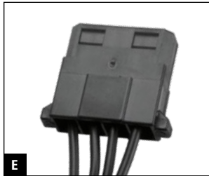
E Max. 1000 mm