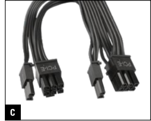
C 550 mm + 150 mm