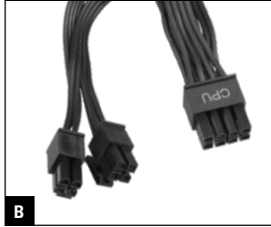
B 600 mm + 150 mm