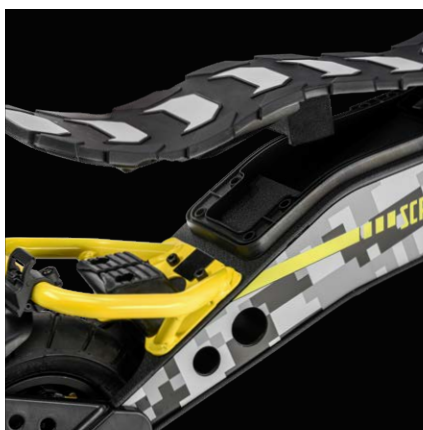
Fino a 45km di autonomia, batteria 499Wh