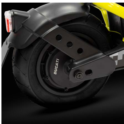
Motore 500W, Peak Power: 950W