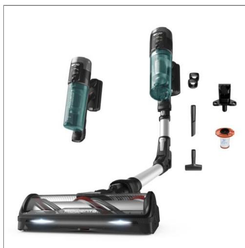
X-Force Flex 13.60, Aspirapolvere Senza Fili, Modello Allergy RH9A32WO