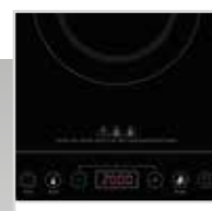
Adatto per pentole da 12cm a 26cm Pan diameter: min 12cm, max 26cm