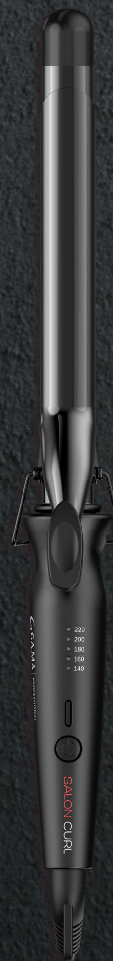
Classic 25 mm