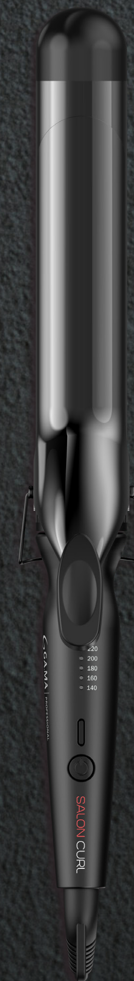
Bouncy 38 mm