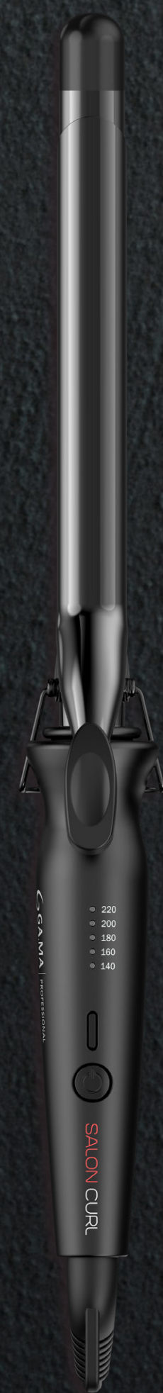
Defined 19 mm