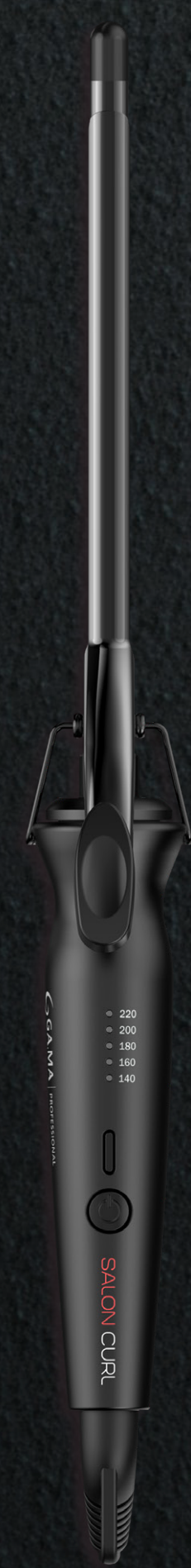
Curly 9 mm