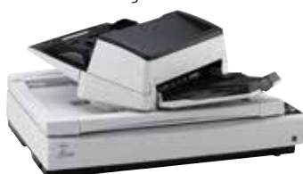
ADF mobile a 180 gradi

Entrambi i modelli di scanner sono caratterizzati da un design, ergonomico e compatto, che si adatta alle preferenze e alle esigenze di tutti gli utenti. L'alimentatore automatico di documenti (ADF) del modello fi-7700 è in grado di scorrere su entrambi i lati o di ruotare di 180 gradi.