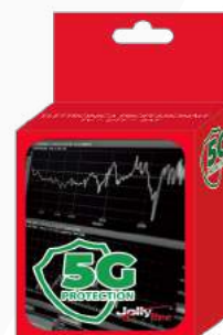
Imballo 8 x 13 x 5 cm