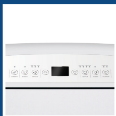
Pannello comandi digitale con display a LED Digital control panel with LED display

ARGO IRO and ARGO IRO PLUS are the portable air conditioners characterized by soft lines. Right compromise between space and shape, they are intuitive to use and easy to program thanks to their elegant control panel. They don't go unnoticed and they can easily adapt to any environment and style. With its heat pump, ARGO IRO PLUS is useful all year round.