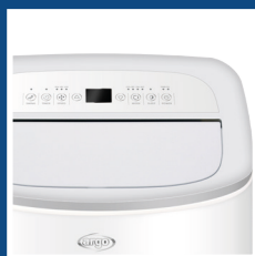
Flap motorizzato Auto-opening and swinging flap