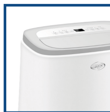
Cura dei dettagli Attention to details