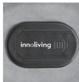
Alloggiamento in plastica

Estrarre la borsa dalla cover in morbido tessuto e posizionare la borsa dell'acqua calda su una superficie piana e stabile. Far scivolare il coperchio dell'alloggiamento in plastica posto sulla superficie della borsa dell'acqua calda, secondo la direzione della freccia indicata, inserire qui il connettore nell'alloggiamento e la spina nella presa di corrente, vedi immagini sotto. Il LED sul connettore si accende.