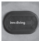
Plastic housing cover

Take out the water bag from the soft cover and place the bag with the plug upwards on a flat and stable surface. Slide the plastic housing cover in the direction of the arrow indicated, then insert the plug into the socket here, see the pictures below. The LED on the connector turns on.