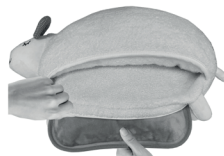
Cover in morbido tessuto

Lo scaldino elettrico si riscalda velocemente (10-15 minuti) e in massima sicurezza. Al termine della fase di riscaldamento l'indicatore LED sul connettore si spegne. A questo punto scollegare il cavo di alimentazione dalla corrente e dal prodotto. La borsa dell'acqua calda è pronta per l'uso.