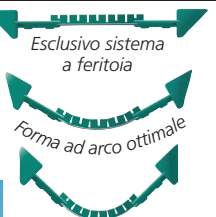
Esclusivo sistema a feritoia