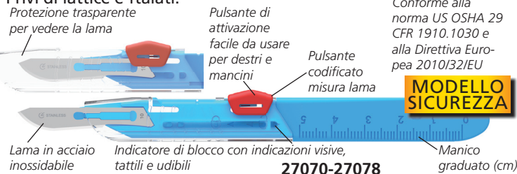
Protezione trasparente per vedere la lama

Bisturi di sicurezza con protezione contro eventuali ferite prima dell'uso, durante le diverse fasi di utilizzo e dopo l'operazione. Privi di lattice e ftalati.