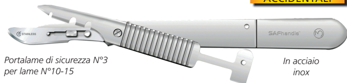
Portalame di sicurezza N°3 per lame N°10-15