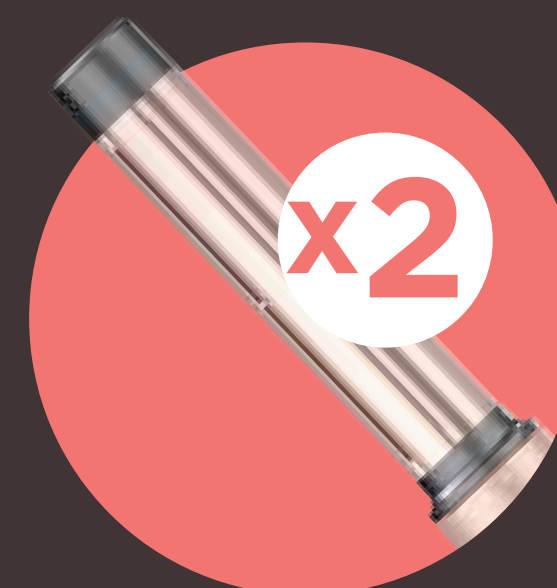
ARRICCIACAPPELLI DESTRO-SINISTRO 32 MM