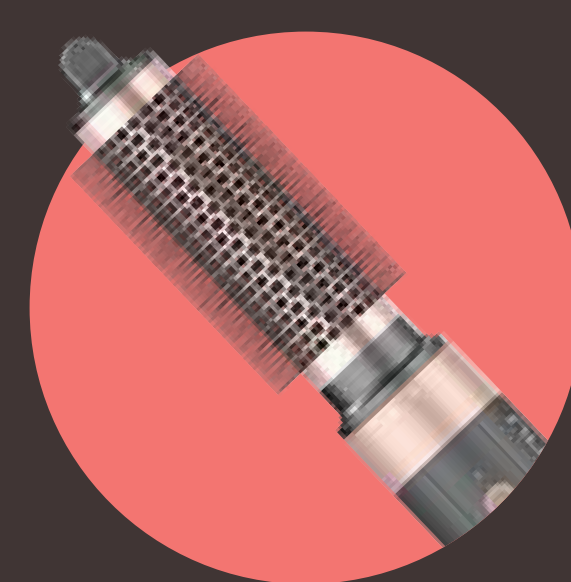
SPAZZOLA ROTONDA 32 MM