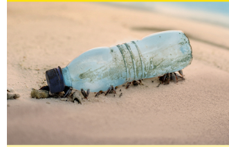
Inchiostro Originale HP