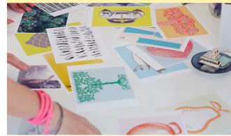
Inchiostro Originale HP