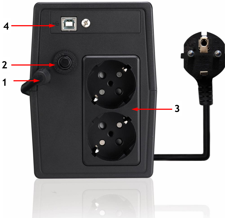
Figura 3 - Pannello Posteriore

Sul retro di ERA PLUS sono presenti (vedi figura 3):