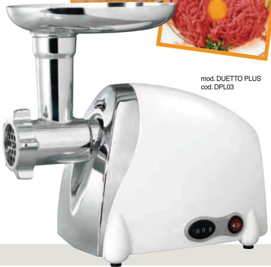
mod. DUETTO PLUS cod. DPL03