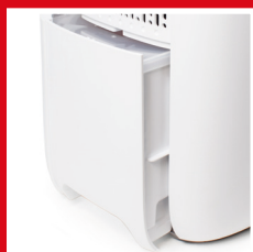
Serbatoio dell'acqua laterale nascosto Hidden lateral water tank