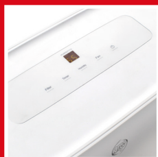
Controllo digitale e display a LED Digital control and LED display

Beautiful, it amazes for its unique design, soft lines and matte finish making it a device out of the ordinary. Thanks to its functionalities it is highly performing: it's silent, it has an air purification system and it works at low temperatures. Programmable from the digital control panel, it fits into any environment like a real design object.