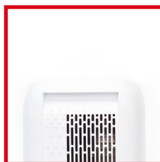
Maniglie laterali integrate Integrated side handles