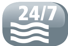
Scarico continuo dell'acqua