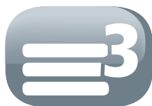
Filtro a 3 strati