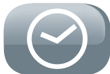
Timer (9 ore)