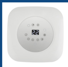
Pannello comandi digitale con display a LED Digital control panel with LED display

A new shape for high performance. The extra-glossy white matches perfectly with the anthracite-colored side strips, giving the appliance a technological appearance. The LED display on the top has a circular shape and the soft touch panel allows immediate control of the functions.