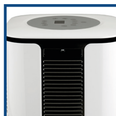
Pratiche maniglie laterali Useful side handles