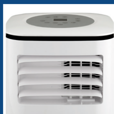
Alette frontali motorizzate Front motorized flaps