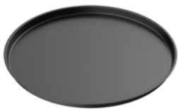
TEGLIA PER PIZZA PIZZA PAN