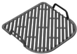
GRIGLIA PER BBQ BBQ GRILL