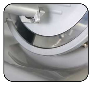
Linea arrotondata priva di spigoli.