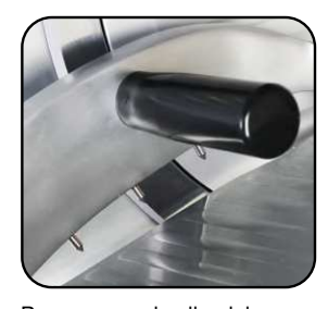
Pressamerce in alluminio protetto con ossidazione anodica.