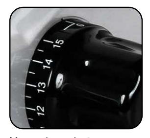
Manopola graduata per un taglio preciso.