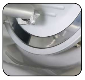
Linea arrotondata priva di spigoli.