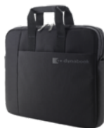
Custodia B116 (PX1880E-2NCA)