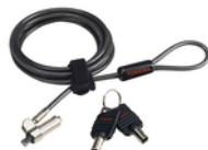
Blocco cavo con chiave ultrasottile (PA5364U-1KCL)