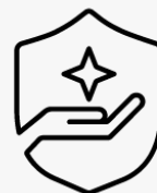
Ritiro e restituzione per 3 anni UC994E