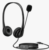
Cuffie stereo USB HP G2 428H5AA