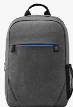
Zaino HP Prelude da 15,6" 2Z8P3AA