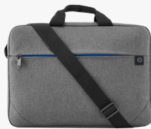
Borsa per notebook HP Prelude da 15,6" 2Z8P4AA