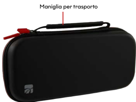
Maniglia per trasporto