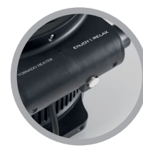
Dispositivo antiribaltamento di sicurezza

POTENTE TERMOVENTILATORE CON TERMOSTATO AMBIENTE 2 INTENSITÀ DI CALORE DISPOSITIVO DI SICUREZZA ANTIRIBALTAMENTO