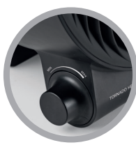
Termostato ambiente regolabile