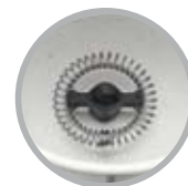
Spirale montalatte per schiuma densa