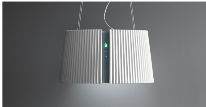
Immagine indicativa del prodotto Potrebbe non corrispondere alla versione selezionata