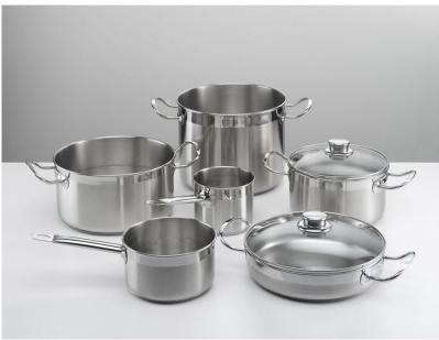
Batteria pentole Induction PRO 8pz. 8210 008