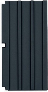
Poggiapentola in ghisa 9601 741