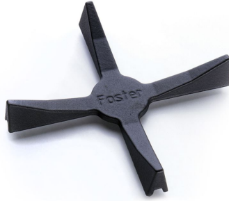
Porta Wok in Ghisa 9601 668