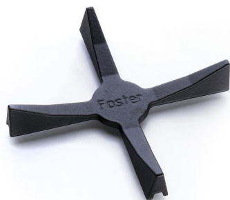
Porta Wok in Ghisa 9601 668