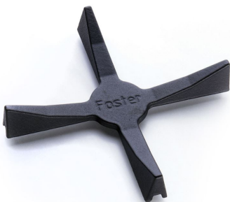
Porta Wok in Ghisa 9601 668