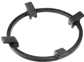
Porta Wok in Ghisa 9601 727