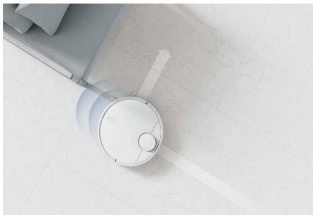
Sistema di navigazione laser LSD