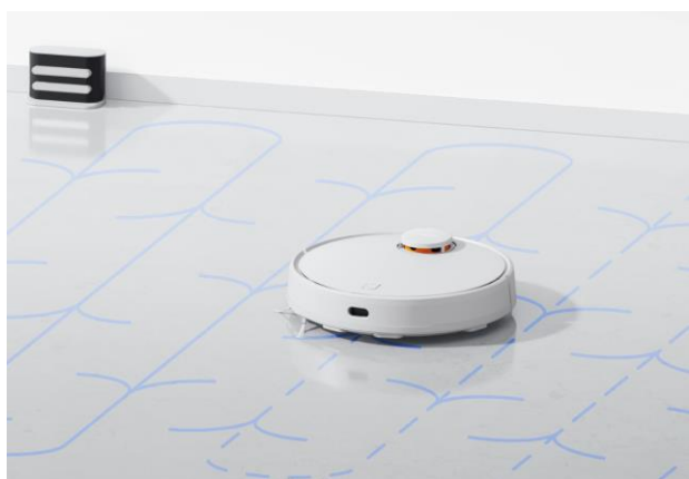
Percorsi di pulizia a zigzag e ad Y