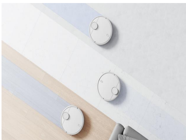
Tre impostazioni dell'acqua