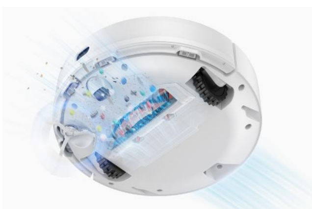
Potente ventola per aspirazione a 4.000Pa