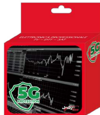
Imballo 10 x 12 x 6 cm Confezione 25 pz.