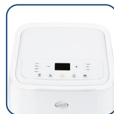
Pannello comandi digitale con display a LED Digital control panel with LED display