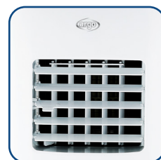
Alette regolabili in senso verticale Vertically adjustable flaps