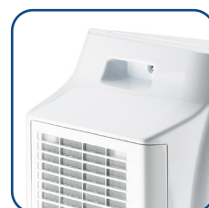
Pratica maniglia sul retro Practical back handle