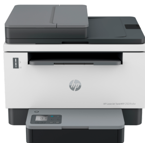
Stampante multifunzione HP LaserJet Tank 2604dw

Scopri prestazioni di livello business e inizia a risparmiare grazie alla stampante multifunzione HP LaserJet Tank 2604dw, con fino a 5.000 pagine incluse. 1