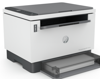
Stampante multifunzione HP LaserJet Tank 2604sdw

Otteni una qualità di stampa professionale a un costo per pagina tra i più bassi della categoria HP.