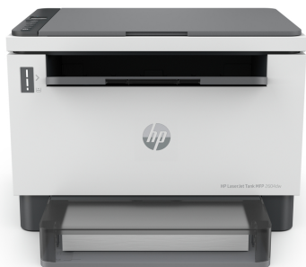
Stampante multifunzione HP LaserJet Tank 2604dw

Scopri prestazioni di livello business e inizia a risparmiare grazie alla stampante multifunzione HP LaserJet Tank 2604dw, con fino a 5.000 pagine incluse. 1