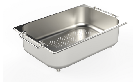
Scolapasta inox 8154 000