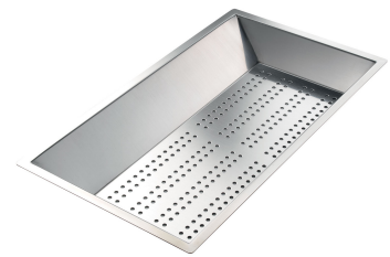
Vaschetta forata inox 8151 000