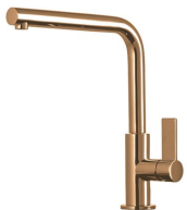
Miscelatore Omega Copper 8497 400