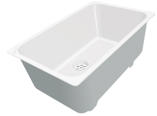
Vaschetta bianca 8153 100