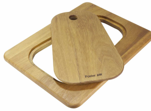
Tagliere Twin in legno Iroko 8644 041