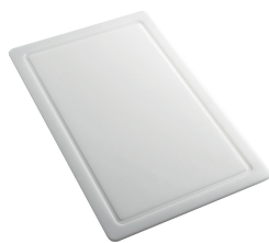
Tagliere in HPDE 8657 001