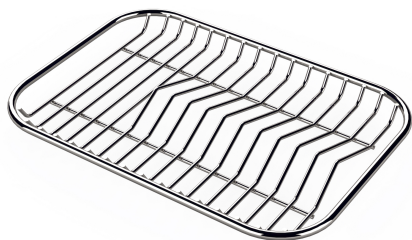
Griglia portapiatti inox 8100 154