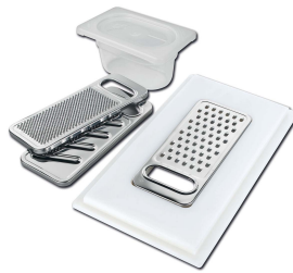
Kit grattugia con supporto per anello e vassoio di raccolta alimenti 8159 101