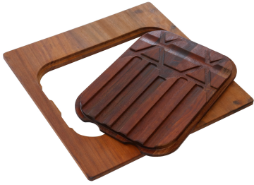
Tagliere Twin in legno Iroko 8644 004