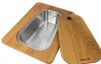
Kit tagliere in legno Iroko con vaschetta scolapasta in acciaio inox 8644 042