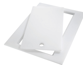
Tagliere Twin in HDPE 8644 101