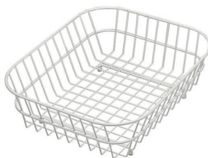
Cestello inox 8612 000