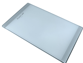
Tagliere in cristallo 8631 300