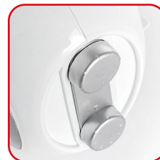
ARGO POP BERRY

Manopole per la regolazione del termostato e delle modalità di funzionamento Knobs for adjusting the thermostat and operating mode