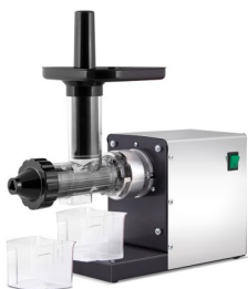
ESTRATTORE DI SUCCHI