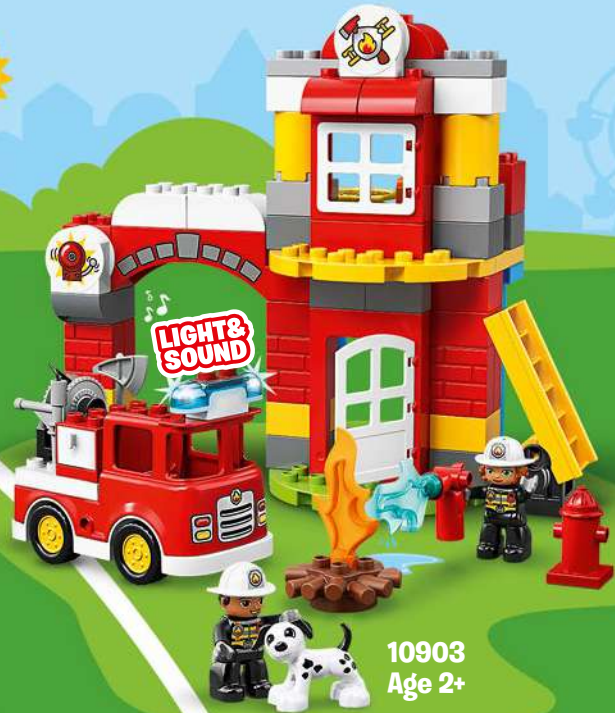
10903 Age 2+

Light and Sound Licht und Geräusche Son et lumière Luz e suoni Luz y sonidos Luz e Som Fény és hang Gaisma un skana 灯光和声音