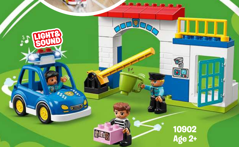
10902 Age 2+