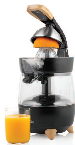
CITRUS JUICER Pure 01.201862.01.001

PARTS DESCRIPTION / ONDERDELENBESCHRIJVING / DESCRIPTION DES PIÉCES / TEILEBESCHREIBUNG / DESCRIPCIÓN DE LAS PIEZAS / DESCRIÇÃO DOS COMPONENTES / DESCRIZIONE DELLE PARTI / BESKRIVNING AV DELAR / OPIS CZĘŚCI / POPIS SOUČÁSTÍ / POPIS SÚČASTÍ