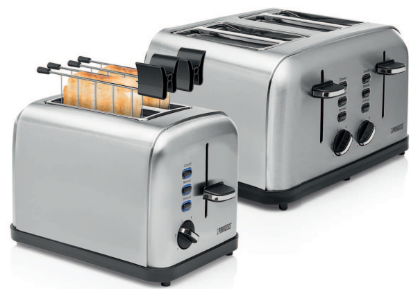
Toaster Steel Style 2 / Toaster Steel Style 4 01.142354.01.001 / 01.142355.01.001

PARTS DESCRIPTION / ONDERDELENBESCHRIJVING / DESCRIPTION DES PIÈCES / TEILEBESCHREIBUNG / DESCRIPCION DE LAS PIEZAS / DESCRIÇÃO DOS COMPONENTES / DESCRIZIONE DELLE PARTI / BESKRIVNING AV DELAR / OPIS CZĘŚCI / POPIS SOUČÁSTÍ / POPIS SOUČASTI / ОПИСАНИЕ ЗАПЧАСТИ