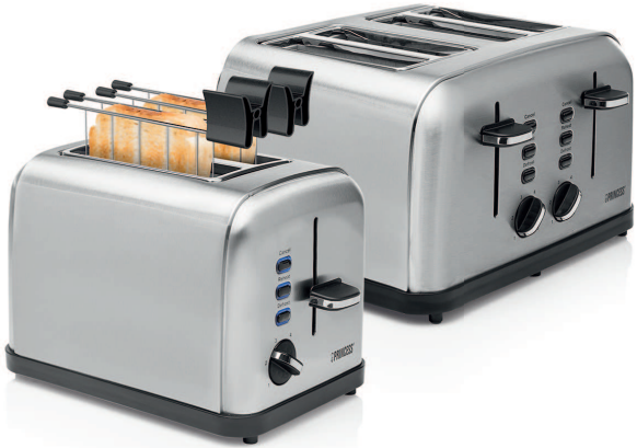
Toaster Steel Style 2 / Toaster Steel Style 4 01.142354.01.001 / 01.142355.01.001

PARTS DESCRIPTION / ONDERDELENBESCHRIJVING / DESCRIPTION DES PIÉCES / TELEBESCHREIBUNG / DESCRIPCIÓN DE LAS PIEZAS / DESCRIÇÃO DOS COMPONENTES / DESCRIZIONE DELLE PARTI / BESKRIVNING AV DELAR / OPIS CZĘŚCI / POPIS SOUČÁSTÍ / POPIS SOUČASTI / ОПИСАНИЕ ЗАПЧАСТИ